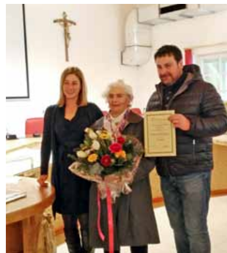
Trentennale sede UTETD Pozza di Fassa