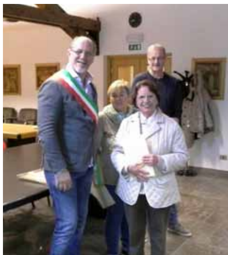
Decennale sede UTETD Ton

Hanno inoltre festeggiato i VENTICINQUE ANNI di attività le sedi di CONDINO e LONA LASES