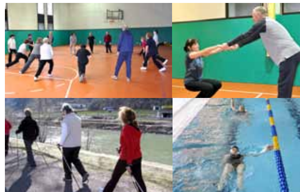
Attività motoria UTETD

Indossati i panni di allievo, hanno sperimentato ed applicato attivamente le conoscenze acquisite integrandole con le loro competenze. Hanno individuato modalità di svolgimento degli esercizi trovando variazioni adeguate a casi specifici e, con la supervisione del loro formatore, hanno studiato una "lezione tipo" presentata poi nel seminario di aggiornamento con i do-