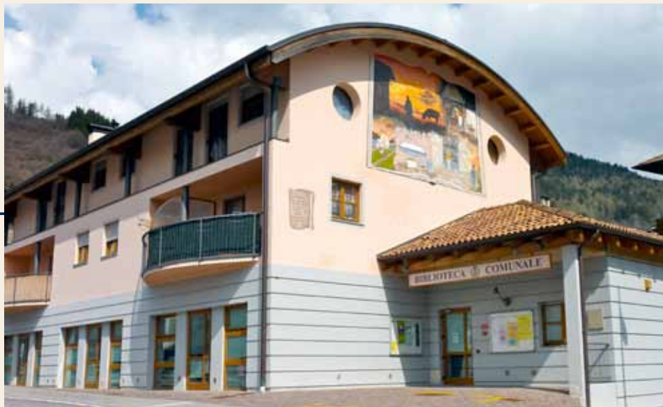
Sede UTETD di Roncone

Le SEDI LOCALI offrono un numero di corsi ed un monte ore annuale di attività culturali ridotto rispetto alla sede centrale.