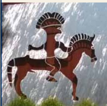
Museo Retico Sanzeno

Seguendo questo percorso sarà possibile accostare criticamente alcuni nodi fondamentali del pensiero etico - filosofico, della storia generale e di quella locale, della dimensione religiosa e spirituale.