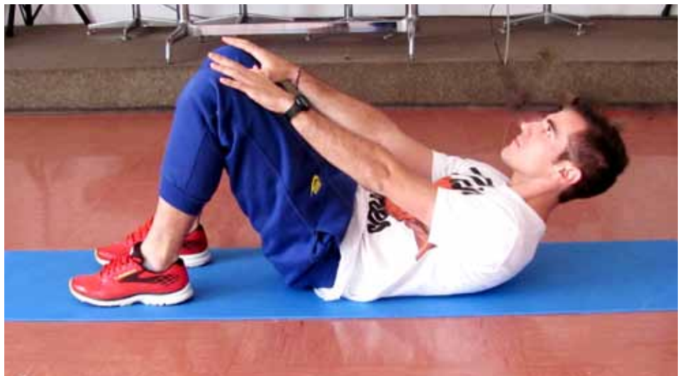
Laboratorio formazione docenti motoria

L'educazione motoria ci accompagna nell'acquisizione di consapevolezza perché ci aiuta a trovare un nuovo rapporto con il nostro corpo. La libertà di scegliere ciò che ci fa stare bene è una conquista che è alla portata di ognuno di noi; la que-