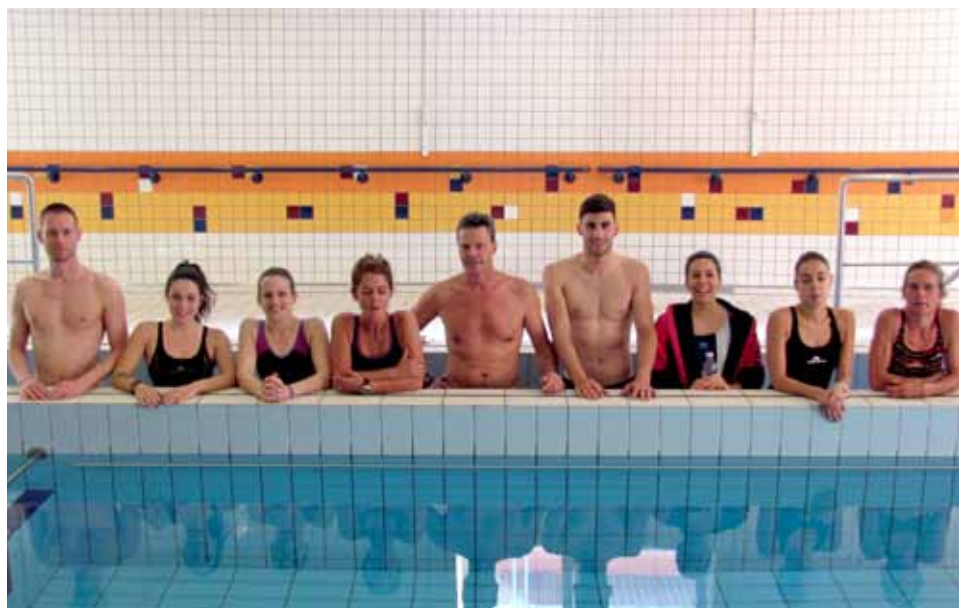
Formazione in acqua docenti motoria UTETD

La proposta UTETD è originale nel suo genere in quanto informa-orientata-offre; per questo motivo nel percorso rivolto ai docenti vengono approfondite tematiche volte a fornire