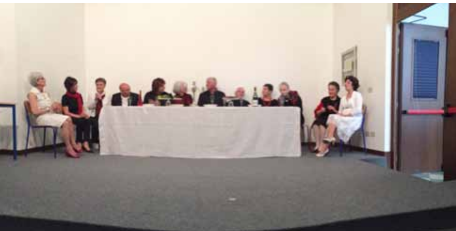
Saggio laboratorio Espressione verbale e corporea

Lo scambio costruttivo con l'altro richiede la riflessione costante sui propri comportamenti verso se stessi, gli altri e l'ambiente che ci circonda e quindi autocontrollo.