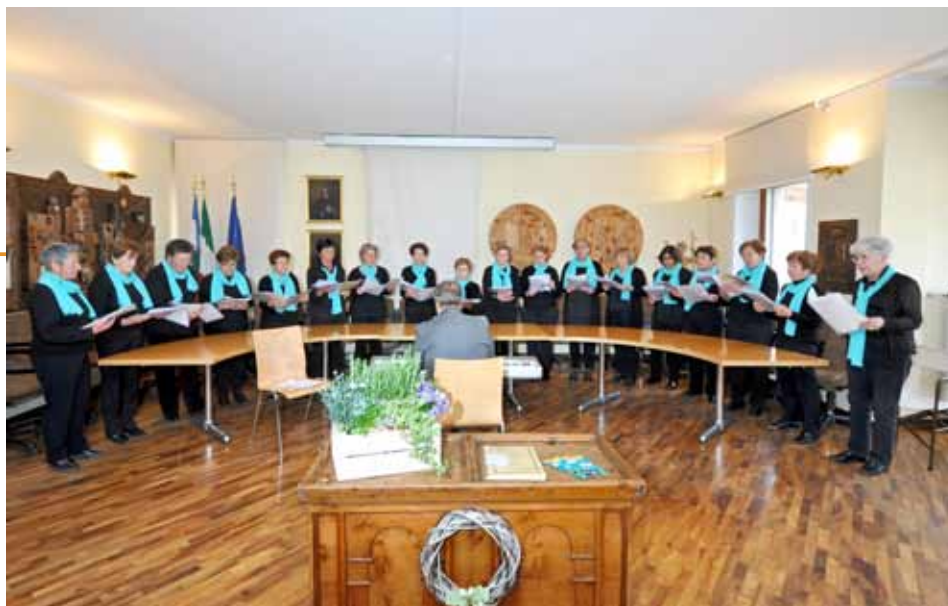
Ventennale sede UTETD Moena

servissero solo come pretesto per passare due ore chiacchierando in allegra compagnia.