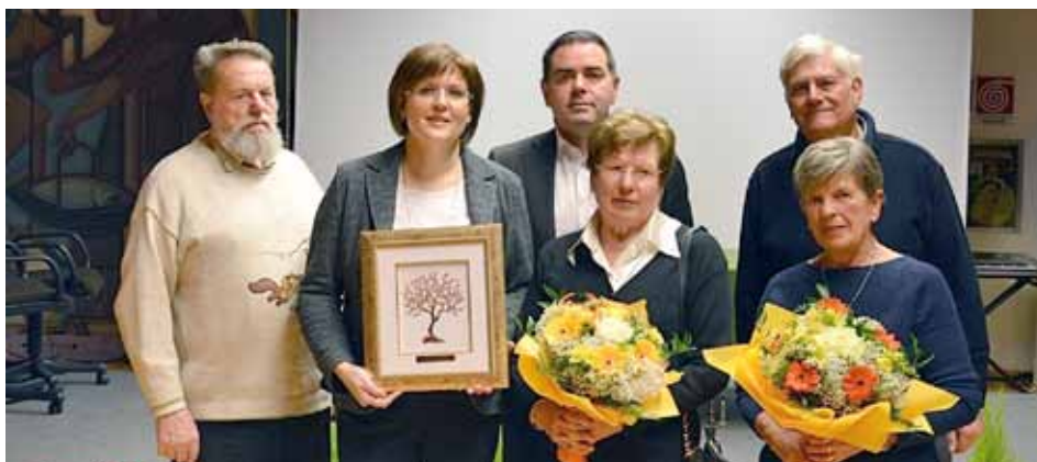
Trentennale sede UTETD Baselga di Pinè